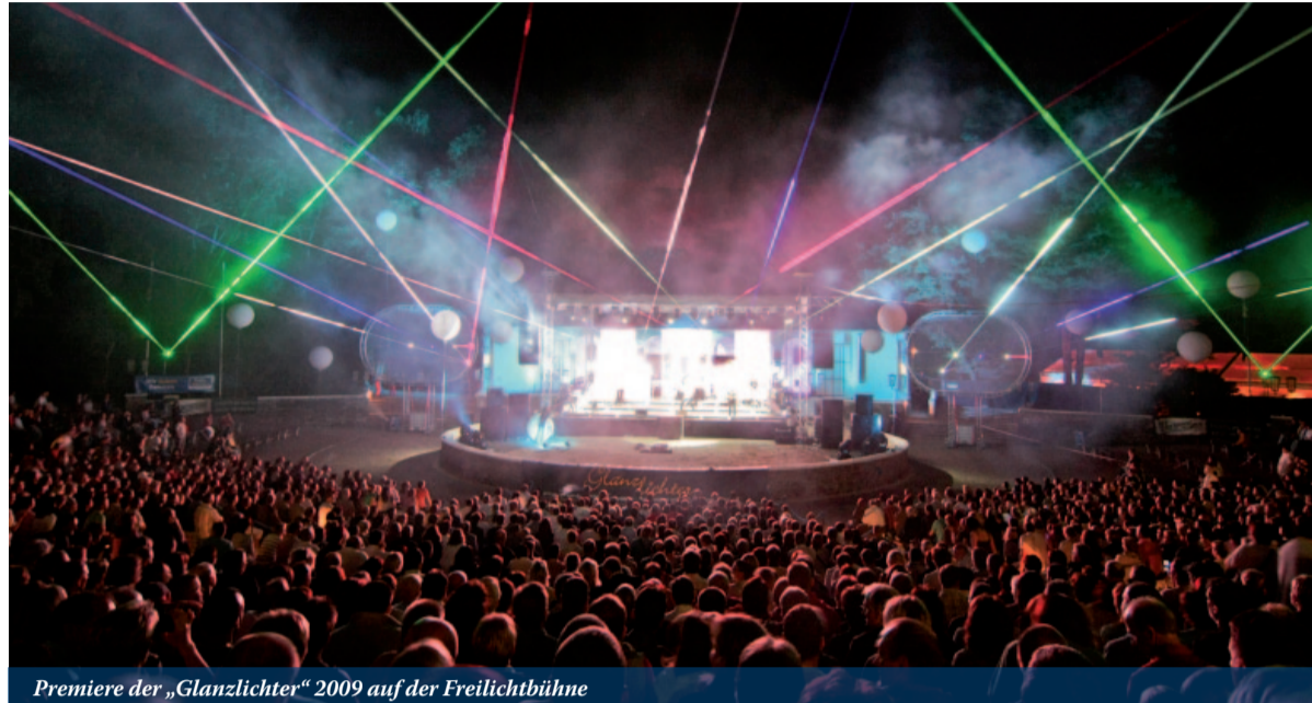
Premiere der „Glanzlichter“ 2009 auf der Freilichtbühne

... bereits mehr als 10.000 Unterschriften eingegangen