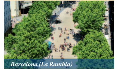
Barcelona (La Rambla)

2010 war es eine Mittelmeer-kreuzfahrt auf der AIDA bella, über die sich der Gewinner des kultCARD-Jahreshauptpreises riesig freute und in diesem Jahr schicken wir Sie in die traumhafte Stadt Barcelona! Gewinnen Sie eine Reise für 2 Personen in die katalanische Metropole , incl. Flug ab Nürnberg und 5 Übernachtungen im 4 Sterne Komfort Hotel Novotel Barcelona City.