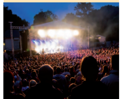
Event auf der Freilichtbühne 2010

Wir sind von der Unterstützung der Bürger überwältigt: Mehr als 10.000 Unterschriften wurden bereits für den weiteren Veranstaltungsbetrieb der Freilichtbühne von Ihnen allen gesammelt. In dieser Ausgabe der KULTOUR-Zeit. möchten wir die Gelegenheit nutzen uns, als KULTOUR Z. GmbH, herzlich bei Ihnen allen für Ihr Engagement zu bedanken! (siehe S. 3)