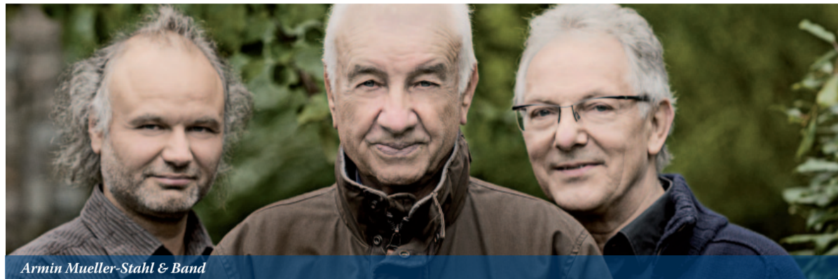
Armin Mueller-Stahl & Band

... Erinnerungen an die DDR musikalisch dargeboten