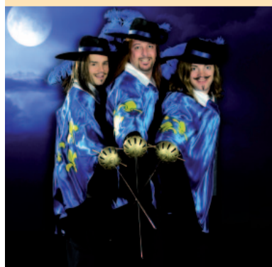
Die Drei Musketiere

Verpassen Sie dieses sensationelle und einzigartige Weihnachts-Spektakel nicht und sichern Sie sich Ihre Tickets für den 20.12.2011 in den Ticket-Shops der KULTOUR Z.