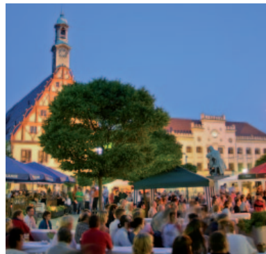
7. „summer swing bei Schumann“