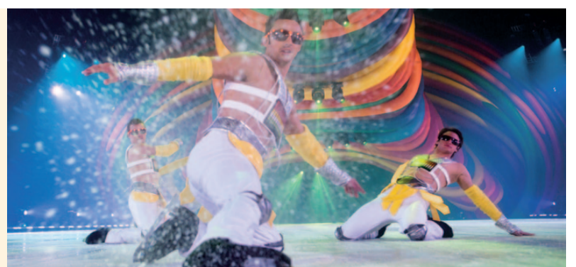
Holiday on Ice