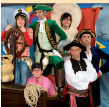
Henrietta und die Schatzinsel

Mit dem Theaterprojekt „Henrietta in Fructonia“ startete die AOK PLUS 2007 eine Präventionskampagne zum Thema Ernährung und Bewegung mit aufmerksamkeitsstarker und interaktiver Ansprache, bei der der Zugang zum Thema in hohem Maße emotional, kreativ und spielerisch erfolgt. Bis heute sahen rund 70.000 Kinder in Sachsen und Thüringen das Stück und setzten sich mit den Inhalten auseinander. Die AOK PLUS möchte mit dem „Henrietta-Projekt“ die sozialen Kompetenzen von Kindern fördern und startet nun mit der Fortsetzung „Henrietta und die Schatzinsel“ durch. Mit dieser Produktion soll vor allem das Selbstbewusstsein von Kindern gestärkt werden. Für beide Veranstaltungen (8.30 / 10.30 Uhr) nimmt die AOK PLUS persönlich Kontakt mit den Grundschulen auf.