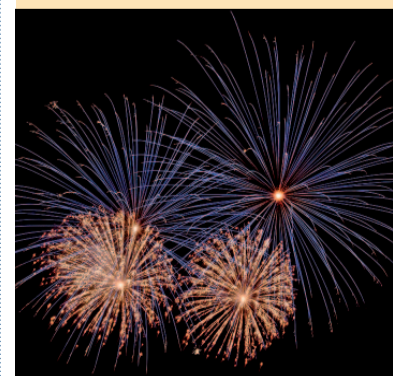
Pyro Masters 2012

Karten für das Feuerwerkfestival am 14.07.2012 auf der Freilichtbühne Zwickau erhalten Sie in den Ticket-Shops der KULTOUR Z. (siehe S. 5), über das Ticket-Telefon 0375. 27 130 sowie an allen bekannten Vorverkaufsstellen der Region.