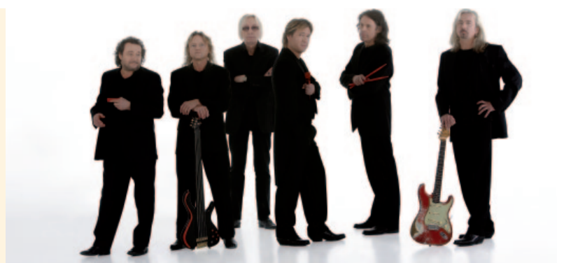
Karat – Ost Rock 2012