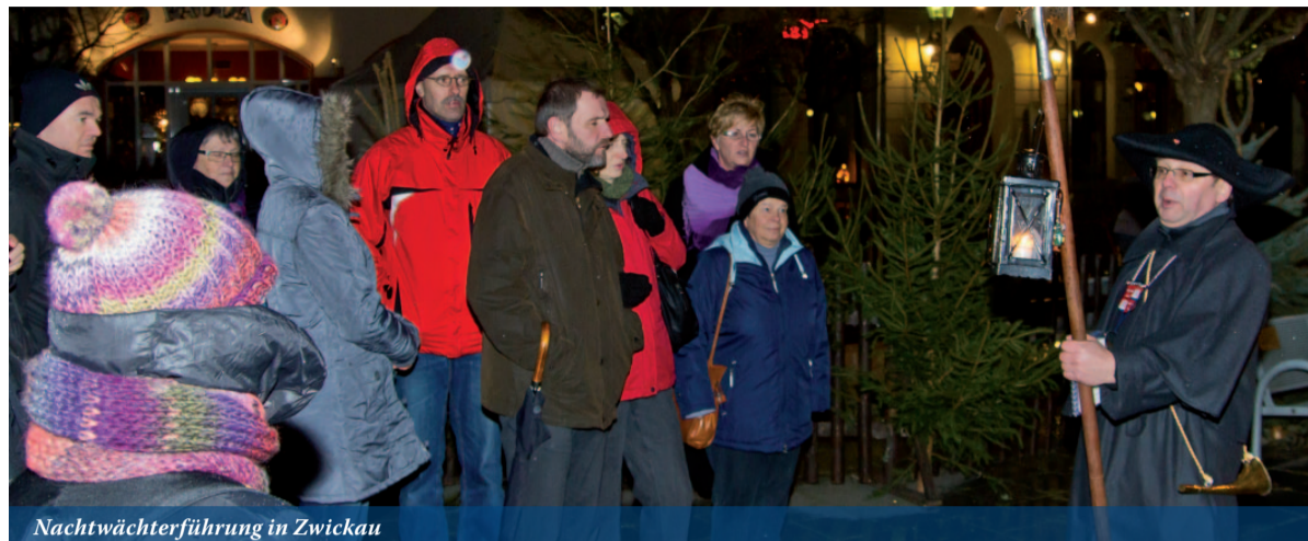
Nachtwächterführung in Zwickau

Vor fast 140 Jahren haben die Zwickauer Nachtwächter ihren letzten Dienst getan.