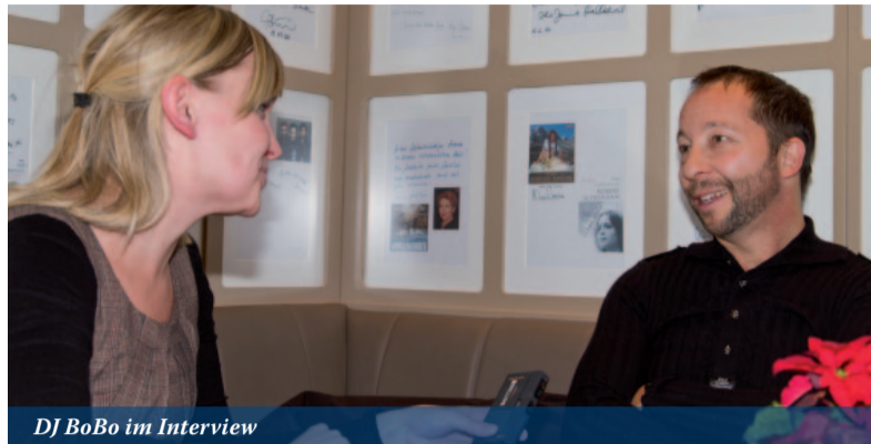
DJ BoBo im Interview

Da müssen sich die Gäste einfach überraschen lassen. Auf alle Fälle können sie sich auf 2 Stunden unglaubliche Bilder, schöne Hits