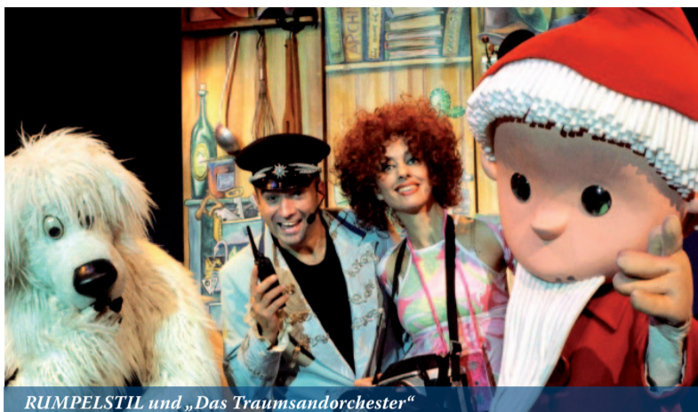
RUMPELSTIL und „Das Traumsandorchester“

Habt Ihr euch schon einmal beim Sandmännchen gucken gefragt, wo die schöne Musik herkommt? Die kommt natürlich vom Traumsandorchester – ein kleines Orchester mit lustigen und auch ein bisschen verdrehten und verträumten Musikanten. Und Ihr könnt dabei sein. Gezeigt wird die Probe für das Traumsandlied. Allerdings geht alles schief, was schief gehen kann. Doch was ist los? Das Schlagzeug hat Stimbruch, die Geigerin hat sich in das Sandmännchen verliebt und die Notenständer sind weg. Nun müssen einige Kinder im Saal die Noten hochhalten. Der Bär