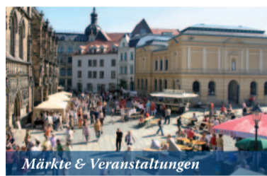
Märkte & Veranstaltungen

Das Ende des Maya-Kalenders am 21.12.2012 steht nach einhelliger Meinung auch für das Ende der Welt. Demnach haben wir nur noch wenige Monate, um endlich die Dinge zu tun, die wir schon immer einmal machen wollten. Falls Sie sich bis Dezember gern die volle KULTOUR-Dröhnung geben, die Stars und Sternchen der Glitzerwelt treffen, ausgelassen Party machen, gute Musik unter freiem Himmel genießen oder einfach mal so richtig lachen wollen, dann schauen Sie bei uns vorbei. Hier nun ein paar Tipps für das laufende Jahr in unseren Veranstaltungsstätten: