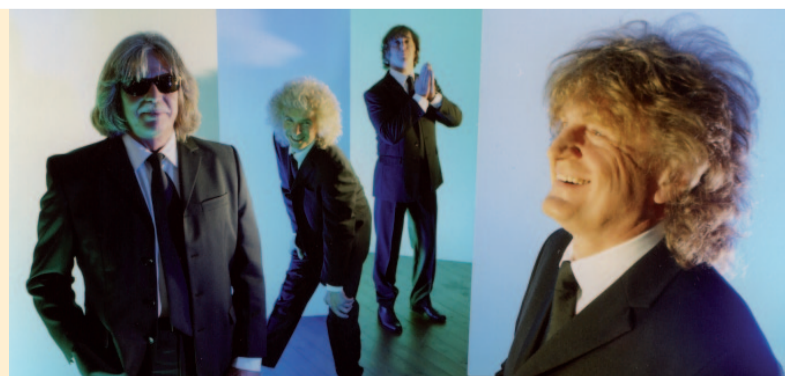
The Lords – Rock & Oldies Zwickau