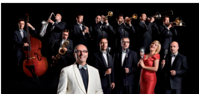
Glenn Miller Orchestra

Online-Ticketbuchungen und Versand: www.kultour-z.de