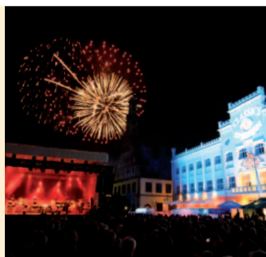
Classics unter Sternen